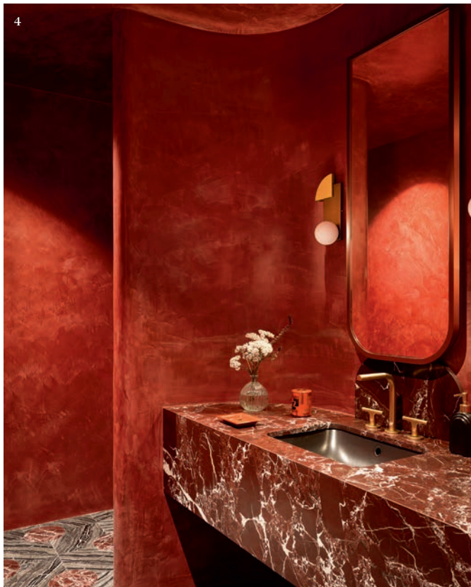
1. 办公空间, Eero Saarinen 为 Knoll 设计的红色镶边核桃木办公桌, 搭配琥珀饰面 Saarinen 办公扶手椅。美国橡木饰面的细木工置物架与地板和天花板无缝贴合, 艺术作品出自 Tyajan Knut, 由 Cadogan Gallery 提供。S-Arm 顶灯仿照 Angelo Lelli 为 Arredoluce 设计的样式。灰蓝色 Gräshoppa 台灯出自 Gubi。蓝色渐变壁纸的图案为天空下的地中海沿岸, 出自 Cole & Son。定制配色的 Fizz 地毯是 Greg Natale 为 Designer Rugs 设计的。2. 媒体室, Gerry O2 Schumacher 饰面的 Casa 组合沙发出自 Camerich。Gentle Kradrat 饰面的 Pumpkin 椅出自 Pierre Paulin。Belle 边桌出自 ClassiCon, Atollo 台灯出自 Oluce。Moire 地毯出自 Greg Natale 的设计。艺术作品来自 Cadogan Gallery。3. 酒窖, 定制配色的 Prisma 大理石砖是 Greg Natale 为 Teranova 设计的。Tahoma 水冷式分体空调出自 EuroCave。Drass 深色青铜与磨砂玻璃的顶灯出自 Square in Circle。天花板的 Ruby Dusk 漆色出自 Benjamin Moore。4. 楼下化妆间, Cerchio 大理石砖是 Greg Natale 为 Teranova 设计的。Rosso Leavnto 大理石洗脸盆为量身定制。Sailing 水龙头出自 Fantini。对页: 别墅建于 1950 年代。